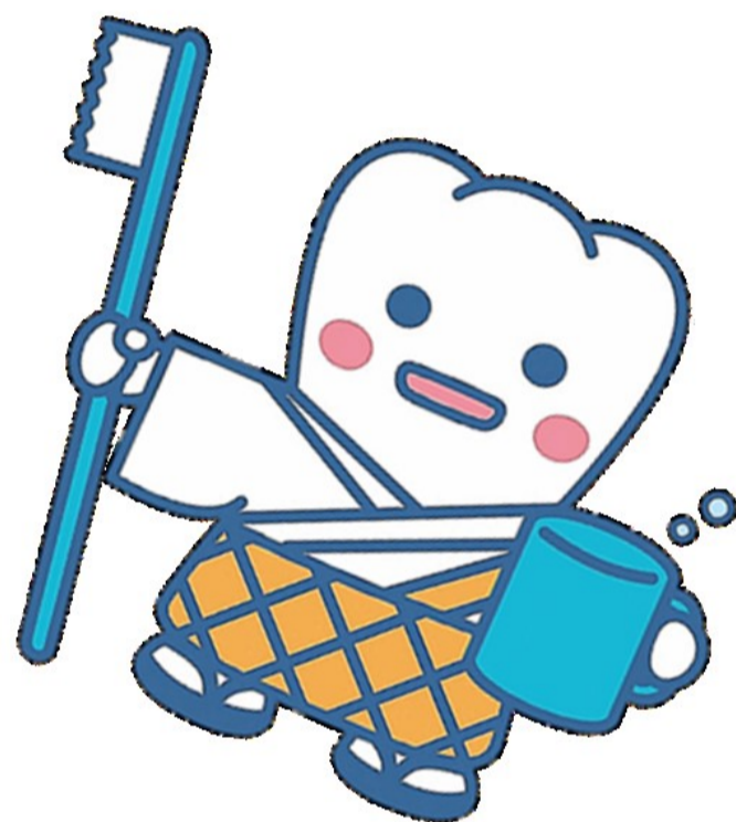
日本歯科医師会PR キャラクター よ坊さん